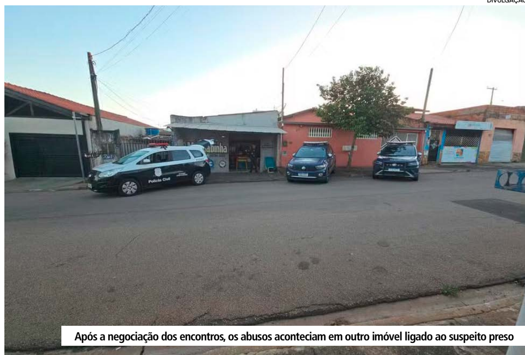
Após a negociação dos encontros, os abusos aconteciam em outro imóvel ligado ao suspeito preso

Durante o cumprimento dos mandados, os policiais encontraram e apreenderam materiais eletrônicos e conteúdos pornográficos que, segundo a corporação, podem contribuir para a identificação de outros envolvidos. Nos aparelhos das vítimas também foram localizados vídeos que, conforme a investigação, eram utilizados para divulgar as adolescentes a possíveis clientes.