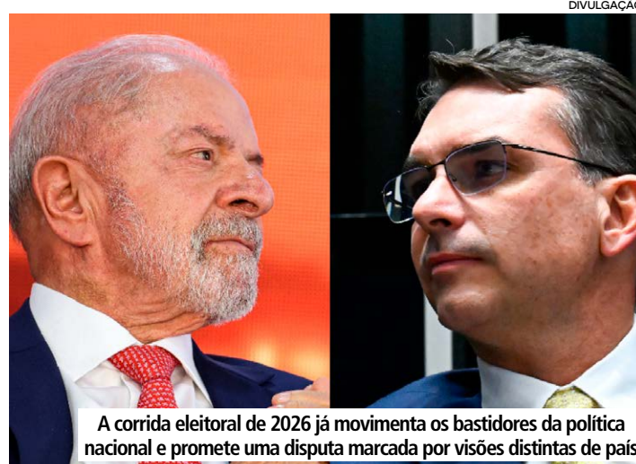
A corrida eleitoral de 2026 já movimentou os bastidores da política nacional e promete uma disputa marcada por visões distintas de país

Para adversários da direita, a sequência de acontecimentos fortaleceu a percepção