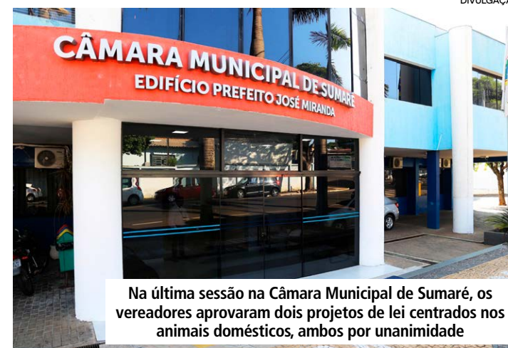
Na última sessão na Câmara Municipal de Sumaré, os vereadores aprovaram dois projetos de lei centrados nos animais domésticos, ambos por unanimidade