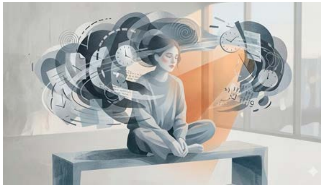
Imagem gerada com Google Imagen 3 - IA