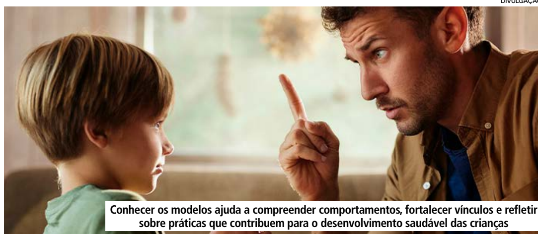
Conhecer os modelos ajuda a compreender comportamentos, fortalecer vínculos e refletir sobre práticas que contribuem para o desenvolvimento saudável das crianças

Estímulo à participação dos filhos nas pequenas decisões da rotina;