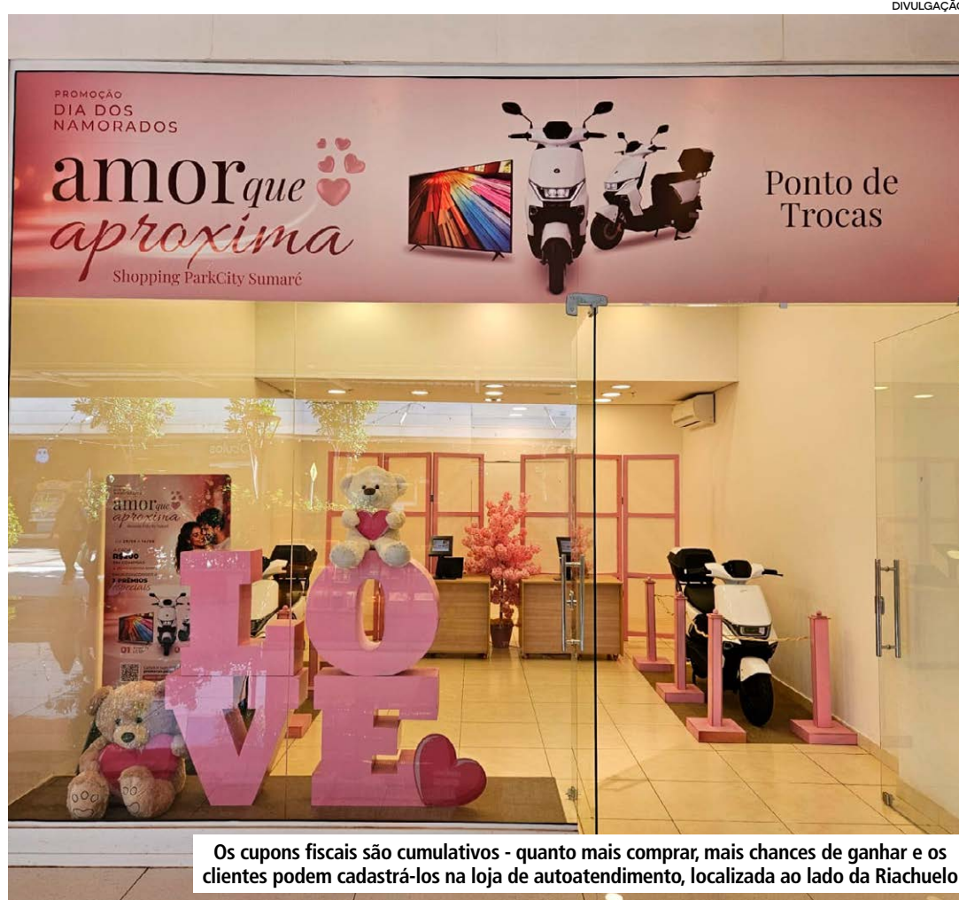
Os cupons fiscais são cumulativos - quanto mais comprar, mais chances de ganhar e os clientes podem cadastrá-los na loja de autoatendimento, localizada ao lado da Riachuelo