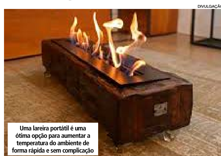
Uma lareira portátil é uma ótima opção para aumentar a temperatura do ambiente de forma rápida e sem complicação

até dobrada em um cesto por perto, faz toda a diferença nos dias frios. É uma solução simples, econômica e eficiente para deixar a sala mais aconchegante e, de quebra, ainda valorizar a decoração. Além de ajudar a manter o corpo quentinho, a manta transforma o espaço em um cantinho mais convidativo e relaxante, perfeito para dias preguiçosos de inverno ou noites de filme.