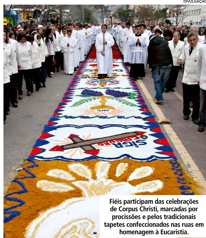
Fiéis participam das celebrações de Corpus Christi, marcadas por procissões e pelos tradicionais tapetes confeccionados nas ruas em homenagem à Eucaristia.