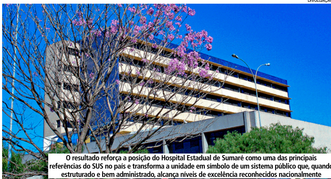
O resultado reforça a posição do Hospital Estadual de Sumaré como uma das principais referências do SUS no país e transforma a unidade em símbolo de um sistema público que, quando estruturado e bem administrado, alcança níveis de excelência reconhecidos nacionalmente

O processo de avaliação começou com 5.279 hospitais que atendem ao SUS em todo o Brasil. Após a aplicação dos critérios técnicos, a seleção foi reduzida para 100 unidades, das quais saíram os dez melhores colocados. A análise final contou com apoio de pesquisadores da Universidade Federal de Minas Gerais e incorporou critérios relacionados à eficiência na utilização de recursos, governança institucional e experiência dos pacientes.