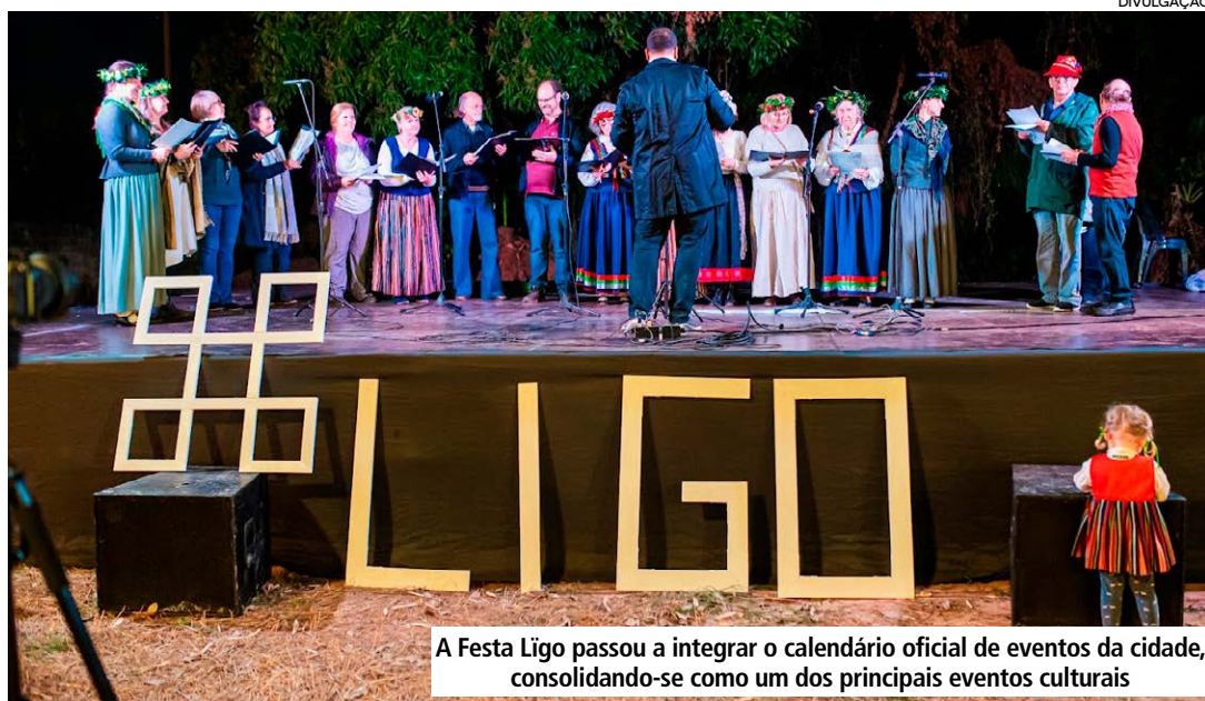
A Festa Ligo passou a integrar o calendário oficial de eventos da cidade, consolidando-se como um dos principais eventos culturais

No domingo, a programação continua com a realização da 4ª edição da Ligo Running, corrida