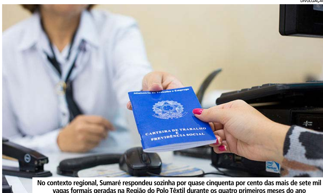
No contexto regional, Sumaré respondeu sozinha por quase cinquenta por cento das mais de sete mil vagas formais geradas na Região do Polo Têxtil durante os quatro primeiros meses do ano

Outro dado que chama atenção é a participação feminina no mercado de trabalho. Segundo os números divulgados, as mulheres ocuparam 2.949 das vagas criadas no quadrimestre, representando praticamente a totalidade do saldo registrado na cidade. A maior presença ocorreu em áreas como serviços, comér-