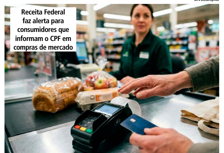
Receita Federal faz alerta para consumidores que informam o CPF em compras de mercado

participando dos tradicionais programas estaduais de prêmios, exigindo sempre os descontos que as grandes redes oferecem aos clientes fidelizados. O fornecimento dos seus dados básicos no ambiente comercial fechado traz benefícios palpáveis, mantendo a sua integridade financeira íntegra.