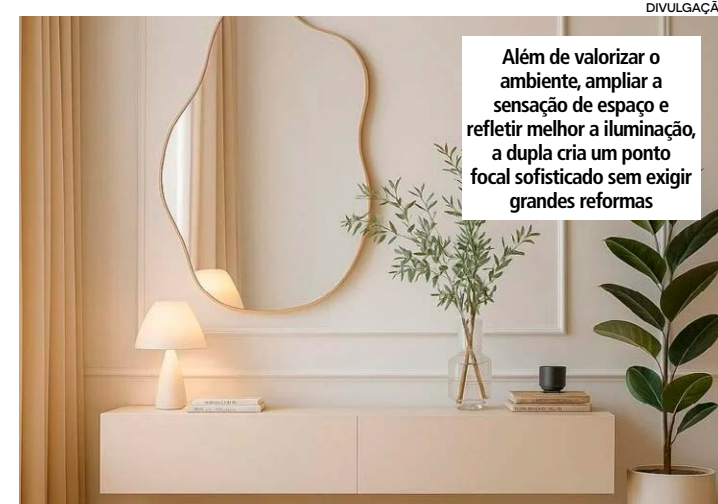
Além de valorizar o ambiente, ampliar a sensação de espaço e refletir melhor a iluminação, a dupla cria um ponto focal sofisticado sem exigir grandes reformas

Um truque simples é escolher um espelho proporcional ao tamanho do aparador. Em geral, o espelho costuma ter largura um pouco menor que o móvel, crian-