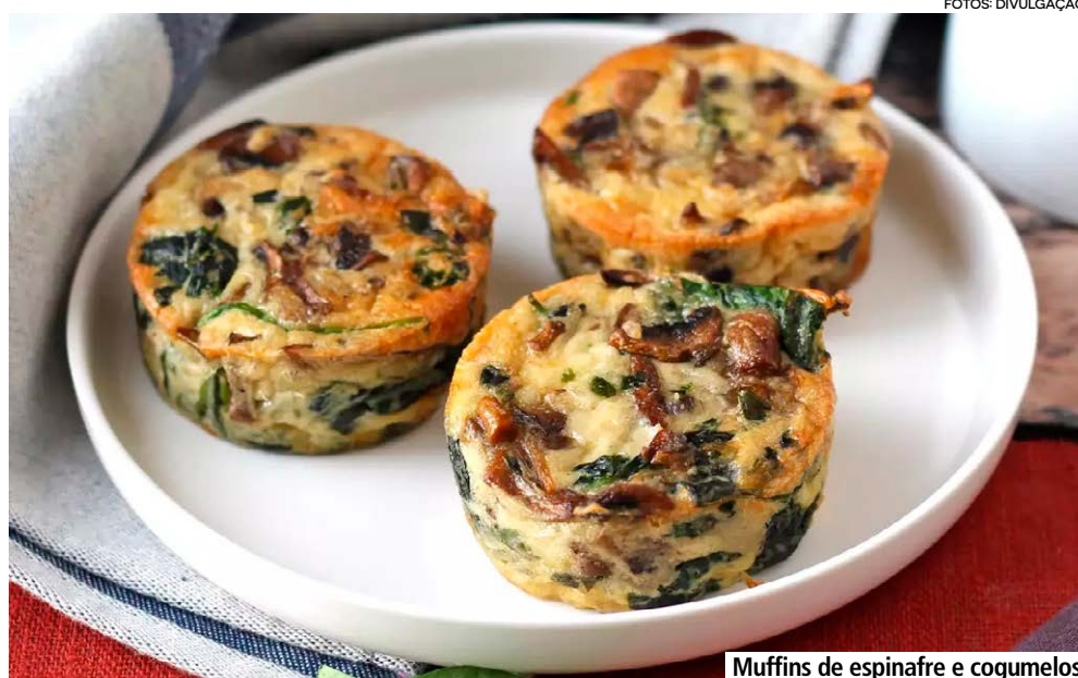
Muffins de espinafre e cogumelos

Nada mais prático e fácil que um prato único para a refeição principal. Por isso nossa