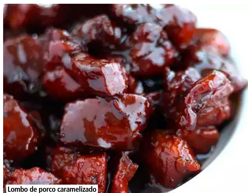
Lombo de porco caramelizado