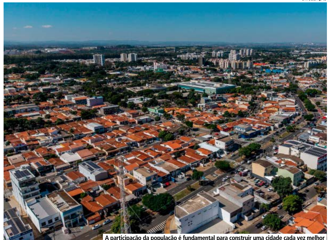
A participação da população é fundamental para construir uma cidade cada vez melhor