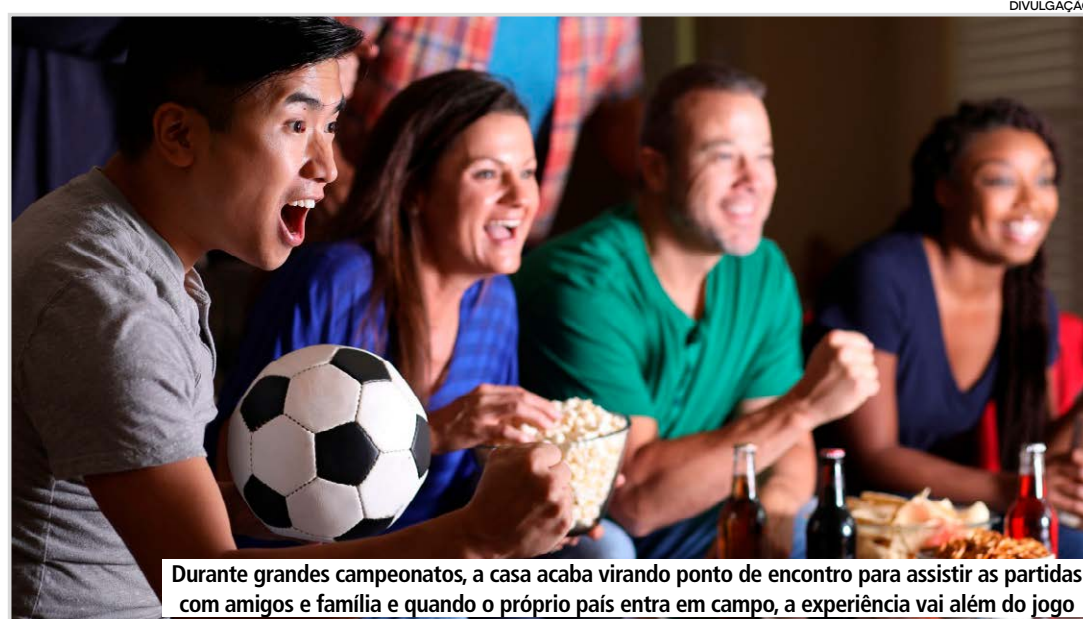
Durante grandes campeonatos, a casa acaba virando ponto de encontro para assistir as partidas com amigos e família e quando o próprio país entra em campo, a experiência vai além do jogo

das acabam fazendo parte da experiência. Por isso, vale organizar uma área de apoio que facilite o acesso sem precisar interromper a partida o tempo todo. Mesas laterais, carrinhos de apoio ou bandejas ajudam a distribuir melhor copos, pratos, molhos e aperitivos pelo ambiente. Para as bebidas geladas, coolers, baldes com gelo, caixas térmicas ou cervejeiras ajudam a evitar idas constantes até a cozinha.