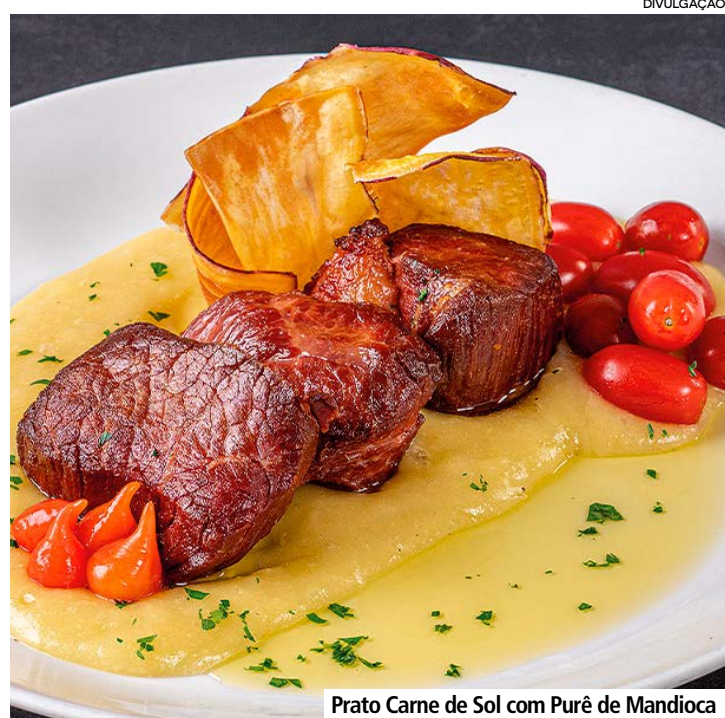
Prato Carne de Sol com Purê de Mandioca

Para quem está em Campinas no feriado e na próxima semana, uma dica gastronômica é o Festival Brasil Sabor 2026, que vai até o próximo dia 14 de junho, evento promovido pela Associação Brasileira de Bares e Resultantes (Abrasel). A edição deste ano, que comemora 20 anos do festival no Brasil, tem como tema “A Seleção da Cozinha Brasileira”, com uma proposta que dialoga com o clima de grandes competições esportivas e posiciona a gastronomia como expressão de identidade e orgulho cultural.