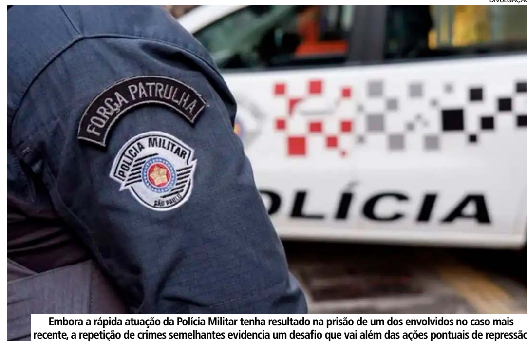
Embora a rápida atuação da Polícia Militar tenha resultado na prisão de um dos envolvidos no caso mais recente, a repetição de crimes semelhantes evidencia um desafio que vai além das ações pontuais de repressão

A sucessão de ocorrências tem ampliado a preocupação da categoria. Entre motoristas da própria cidade e de municípios vizinhos, cresce a percepção de que determinadas