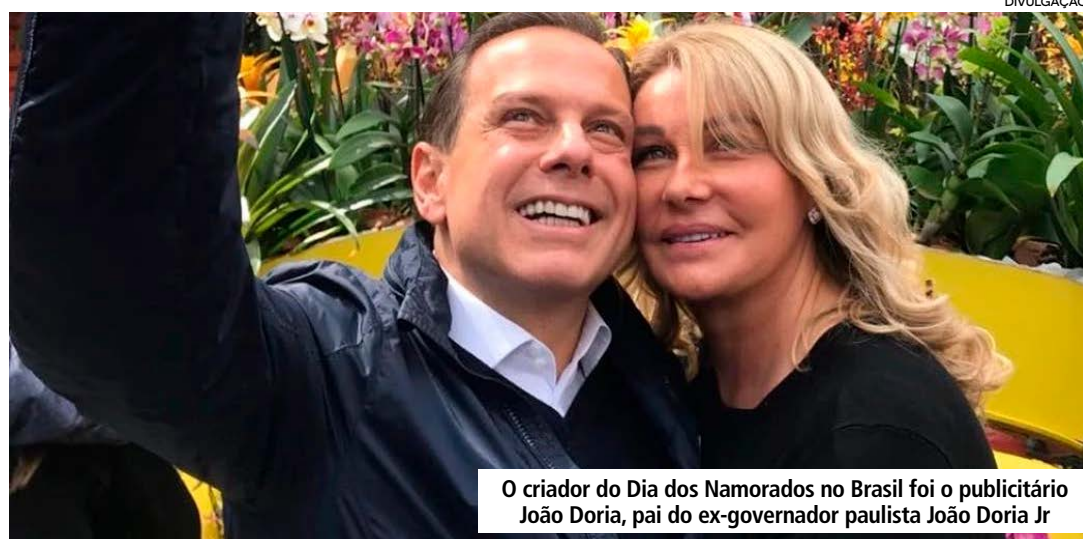
O criador do Dia dos Namorados no Brasil foi o publicitário João Doria, pai do ex-governador paulista João Doria Jr

Em cidades como Sumaré e em toda a Região Metropolitana