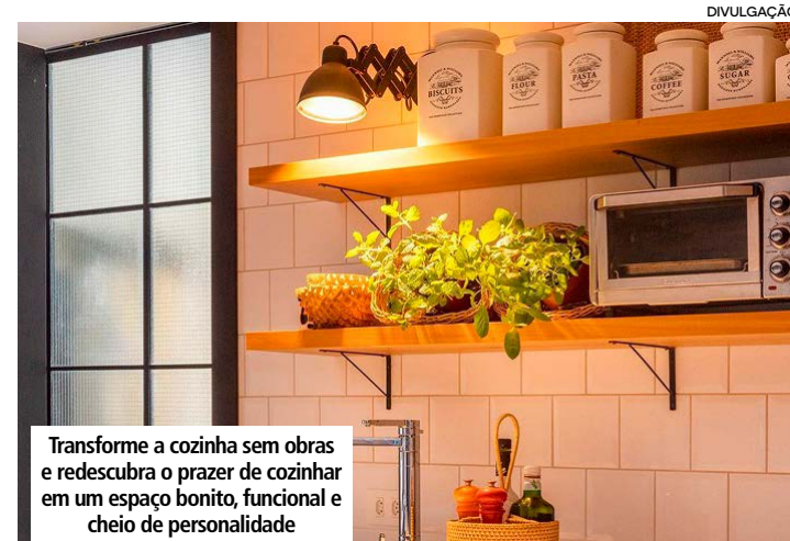
Transforme a cozinha sem obras e redescubra o prazer de cozinhar em um espaço bonito, funcional e cheio de personalidade

Muitas vezes, o que falta na cozinha não é espaço, mas organização. Investir em soluções simples pode renovar completamente o ambiente e facilitar o dia a dia. Use potes padronizados e cestos para otimizar armários, barras e suportes para organizar utensílios e frutas nas paredes, e prateleiras para deixar objetos à mostra. Além de funcional, a organização valoriza a decoração, dando um ar moderno e acolhedor ao espaço.