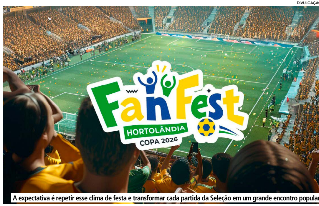
A expectativa é repetir esse clima de festa e transformar cada partida da Seleção em um grande encontro popular

As Fan Fests se consolidaram mundialmente como uma das principais atrações paralelas da Copa do Mundo, reunindo