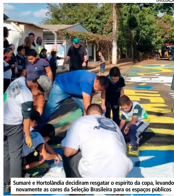
Sumaré e Hortolândia decidiram resgatar o espírito da copa, levando novamente as cores da Seleção Brasileira para os espaços públicos