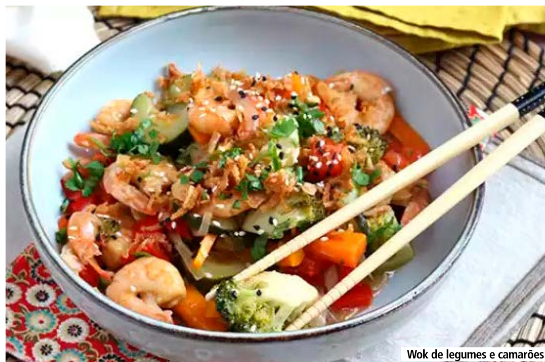
Wok de legumes e camarões

sugestão de hoje é este wok de legumes que além de nutritivo é completo, saudável e versátil, se não gosta de 1 legume, ou mesmo do camarão, retire, simples assim. Confira o passo a passo e solte a imaginação na hora de preparar este prato asiático.