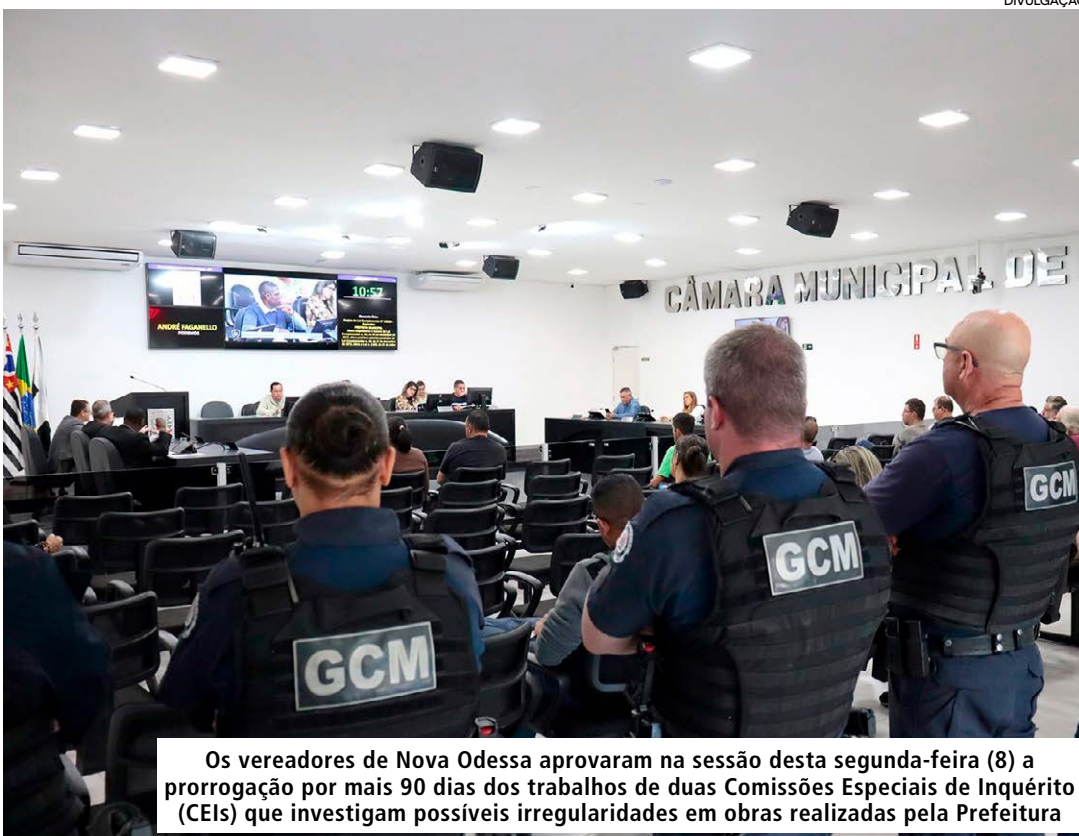
Os vereadores de Nova Odessa aprovaram na sessão desta segunda-feira (8) a prorrogação por mais 90 dias dos trabalhos de duas Comissões Especiais de Inquérito (CEIs) que investigam possíveis irregularidades em obras realizadas pela Prefeitura

Os vereadores de Nova Odessa aprovaram na sessão desta segunda-feira (8) a prorrogação por mais 90 dias dos trabalhos de duas Comissões Especiais de Inquérito (CEIs) que investigam possíveis irregularidades em obras realizadas pela Prefeitura. As comissões apuram denúncias relacionadas à construção de calçadas em diversos pontos da cidade e às obras de revitalização e desassoreamento do Parque Ecológico Municipal Isidoro Bordon.