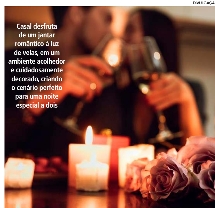
Casal desfruta de um jantar romântico à luz de velas, em um ambiente acolhedor e cuidadosamente decorado, criando o cenário perfeito para uma noite especial a dois

Deixe o quarto arrumado e decorado com flores, velas