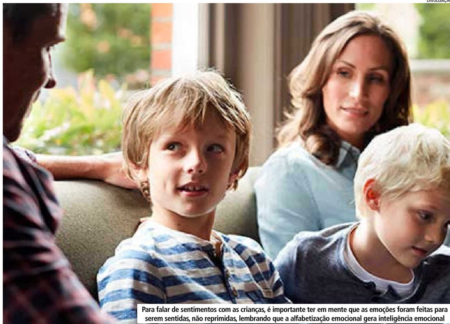
Para falar de sentimentos com as crianças, é importante ter em mente que as emoções foram feitas para serem sentidas, não reprimidas, lembrando que a alfabetização emocional gera inteligência emocional

Os filhos se espelham no comportamento das pessoas com quem têm maior convívio. Para conseguir falar de sentimentos com eles, em primeiro lugar, é preciso mostrar que você sabe ad-