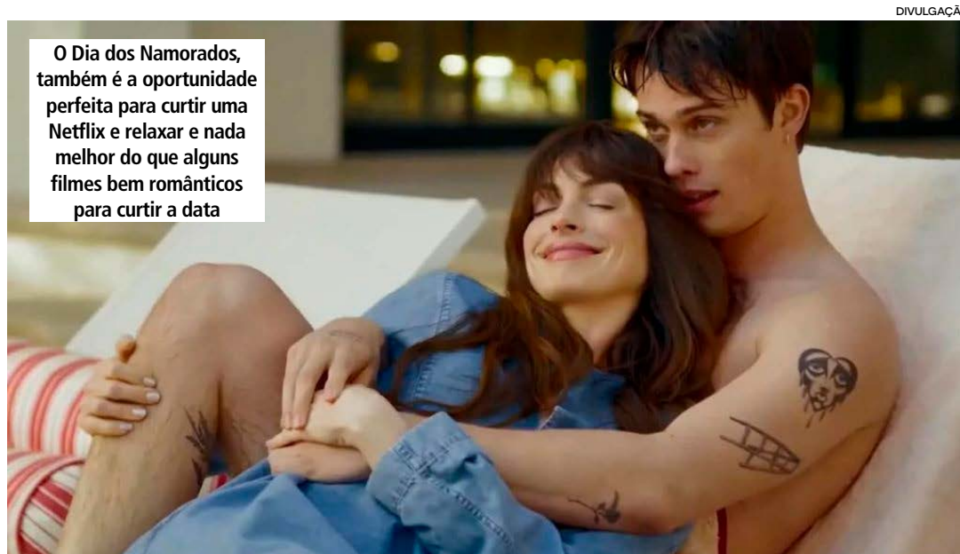
O Dia dos Namorados, também é a oportunidade perfeita para curtir uma Netflix e relaxar e nada melhor do que alguns filmes bem românticos para curtir a data

Se o que vocês querem no Dia dos Namorados é elevar a temperatura, não tem outro filme para escolher! Afinal, a história de Anastasia e Mr. Grey rodou o mundo com suas polêmicas. Em todo caso, acompanhar o romance da jovem estudante tímida e do bilionário conquistador em uma história erótica e en-