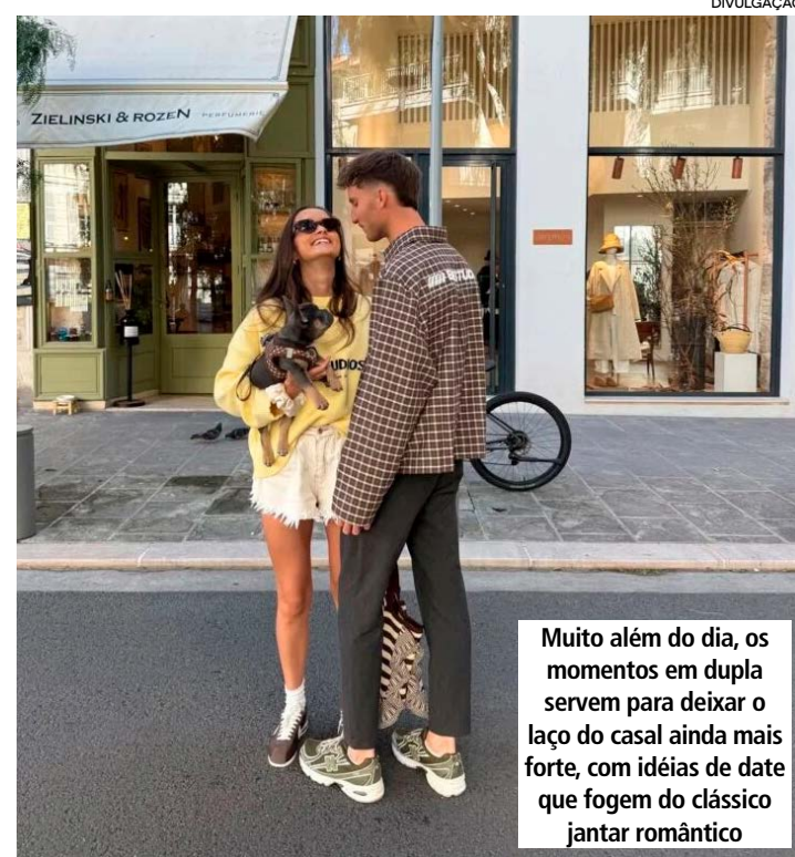
Muito além do dia, os momentos em dupla servem para deixar o laço do casal ainda mais forte, com ideias de date que fogem do clássico jantar romântico