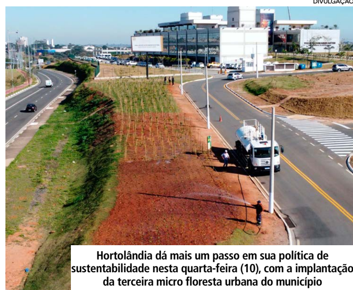
Hortolândia dá mais um passo em sua política de sustentabilidade nesta quarta-feira (10), com a implantação da terceira micro floresta urbana do município

A proposta das micro florestas urbanas vai além do paisagismo. Esses espaços funcionam como importantes ferramentas ambientais dentro das cidades, contribuindo para a redução das ilhas de calor, melhoria da qualidade do ar, aumento da biodiversidade e criação de refúgios para aves,