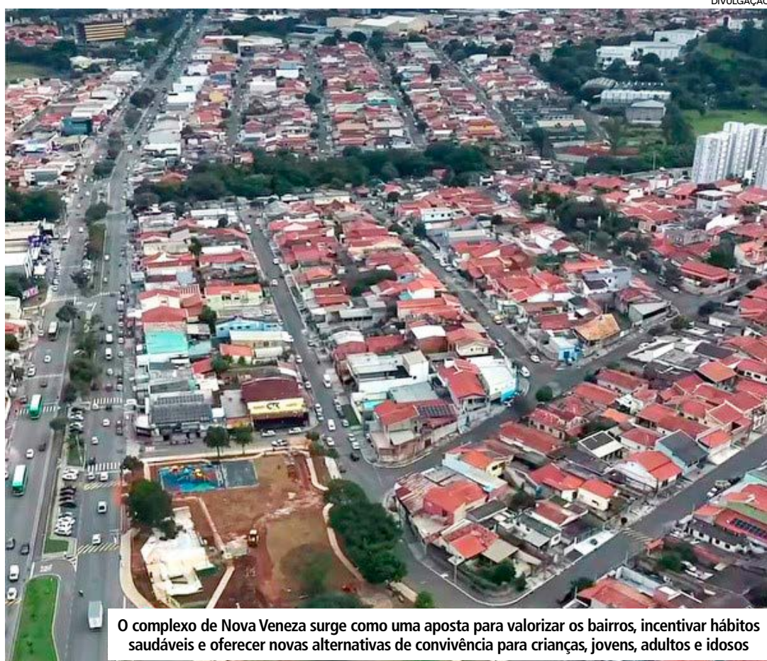
O complexo de Nova Veneza surge como uma aposta para valorizar os bairros, incentivar hábitos saudáveis e oferecer novas alternativas de convivência para crianças, jovens, adultos e idosos