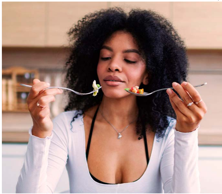
Diante de emoções como ansiedade, tristeza ou tédio, o cérebro busca uma compensação rápida; e a comida funciona como um regulador emocional de efeito rápido