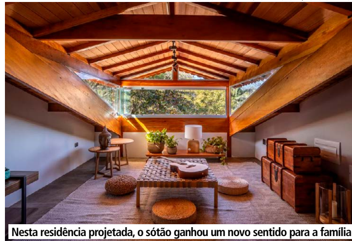
Nesta residência projetada, o sótão ganhou um novo sentido para a família

pensável por estar diretamente sob o telhado, o sótão está mais exposto às variações de temperatura.