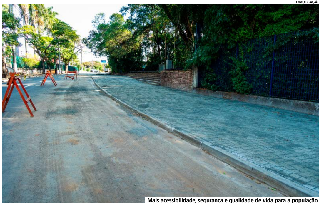
Mais acessibilidade, segurança e qualidade de vida para a população

Garantir o direito de ir e vir da população é uma das premissas da Administração Municipal, por isso, a atual gestão se empenha em garantir boas condições de zeladoria nas ruas da cidade. Nos últimos meses, a Secretaria de Obras vem realizando um trabalho contínuo e dedicado à manutenção das calçadas da cidade. Ao todo, foram mais de 10 quilômetros revitalizados, garantindo melhores condições de acessibilidade, segurança aos pedestres e contribuindo para o embelezamento urbano.