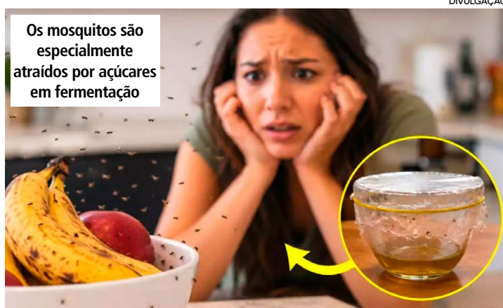
Os mosquitos são especialmente atraídos por açúcares em fermentação